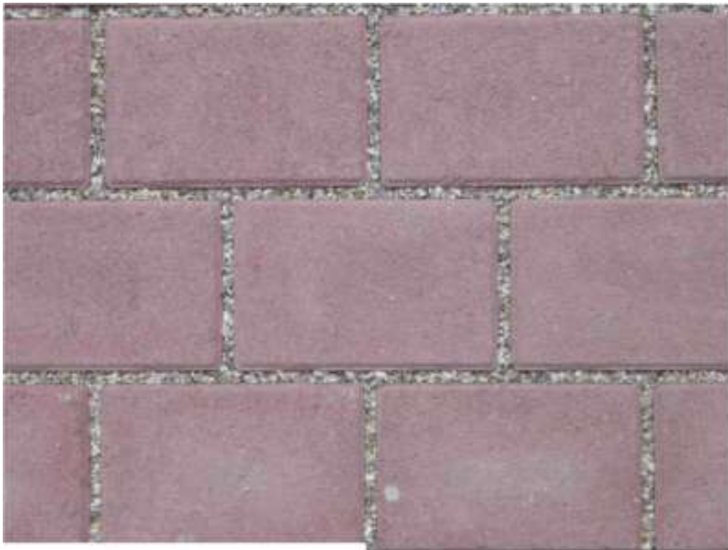
III.1: Pavage Arconda-éco