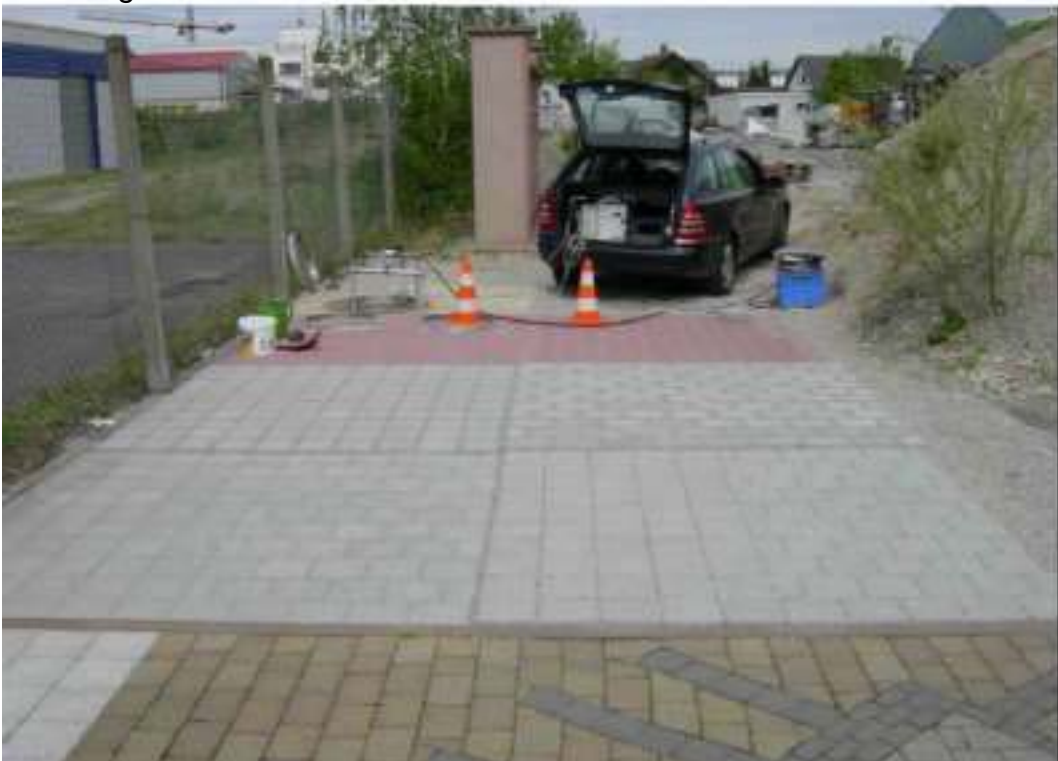
III. 2: Surface d'essai