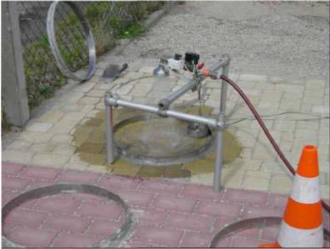
III.3: Dispositif d'essai