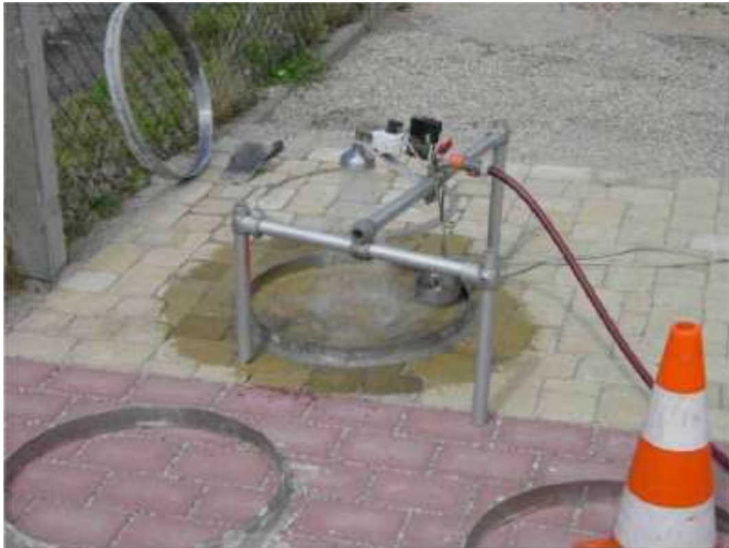
III.3: Dispositif d'essai