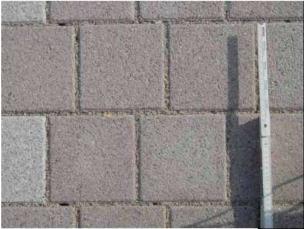
III.1: Pavage Pasero joints 6,5 mm pose décalée