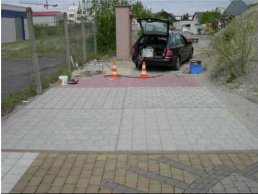
III. 2: Surface d'essai