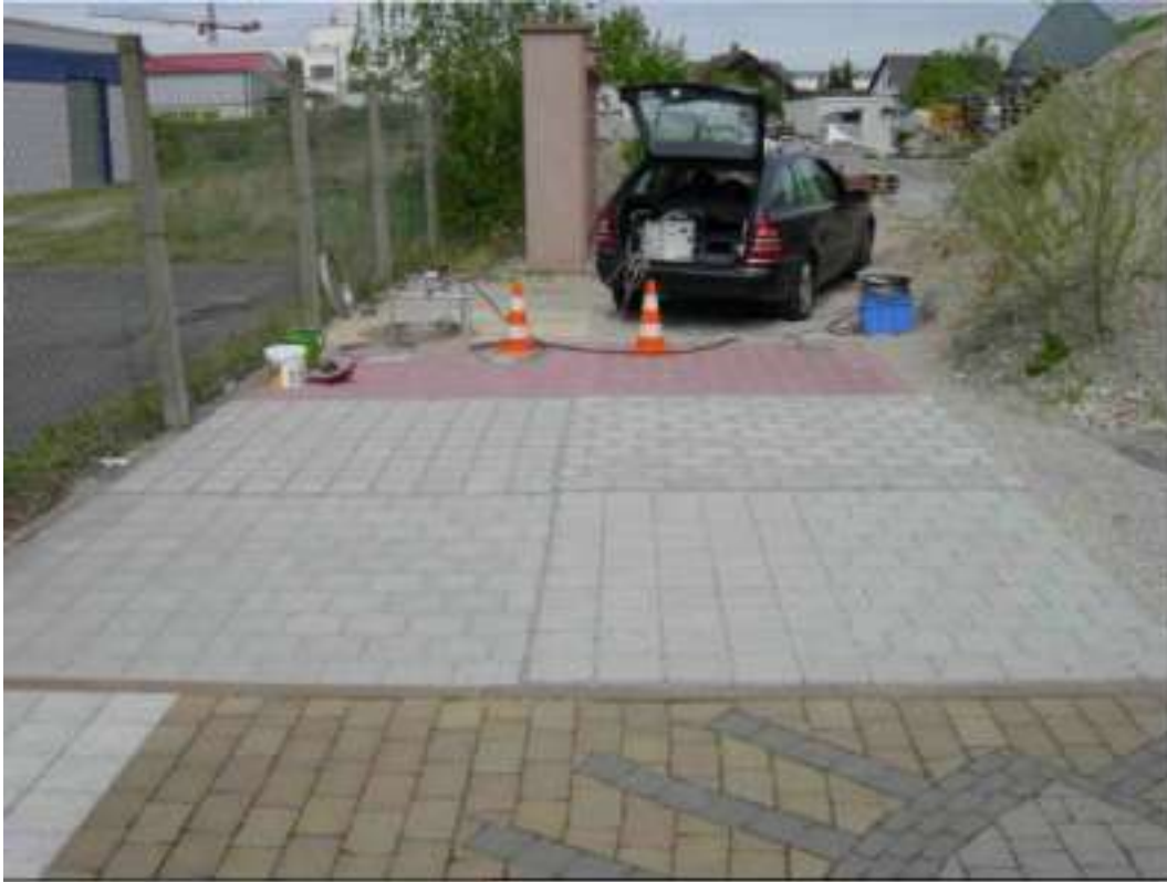
III. 2: Surface d'essai