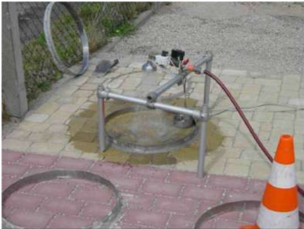
III.3: Dispositif d'essai