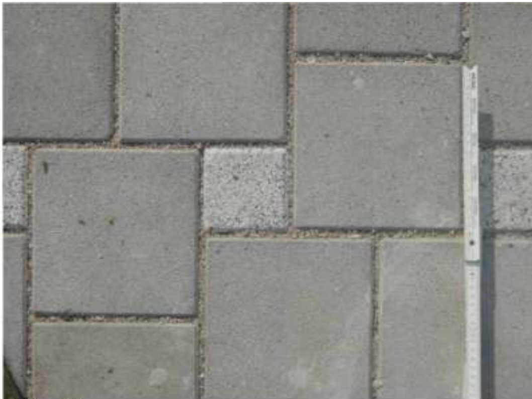
Bild 1: Pfl III. 1: Pavage Pasero joint 6,5 mm pose type Chemnitz